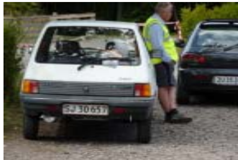
Bonke ved Parc' fermé