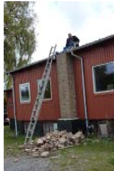
Bonke har fået banket skorstenen ned i taghøjde