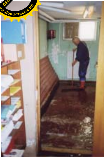
Arne i gang med at feje det sidste vand ud fra det bagerste rum.