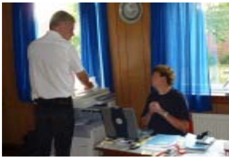
Løbsleder og beregner får en lille snak