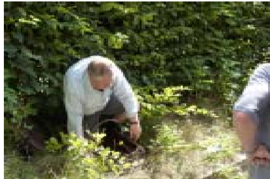
Fra klubrally i august. Bonke kommer op fra kloarken og konstaterer at afløbet er stoppet