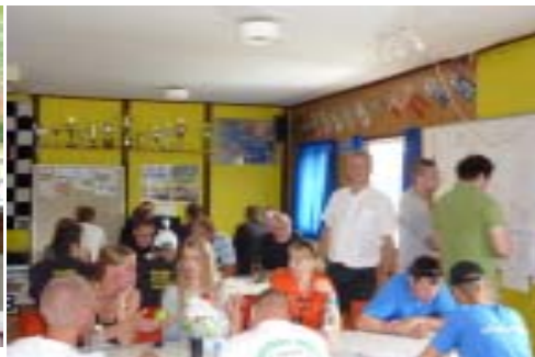
Der ventes på resultater.