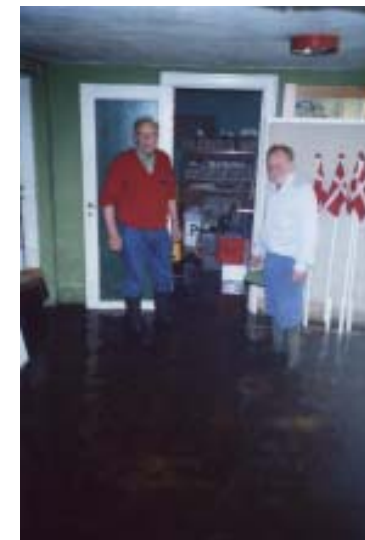
Der kom gang i pumperne